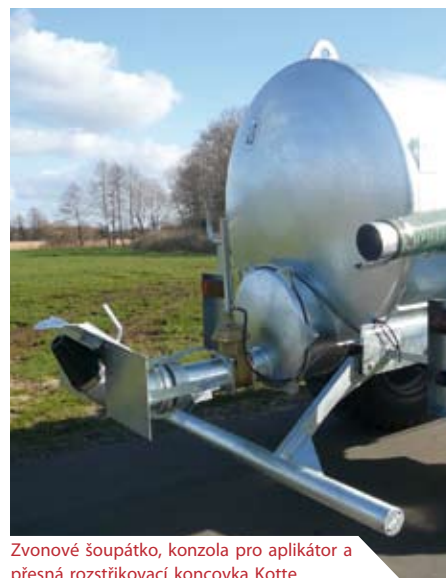
Zvonové šoupátko, konzola pro aplikátor a přesná rozstřikovací koncovka Kotte