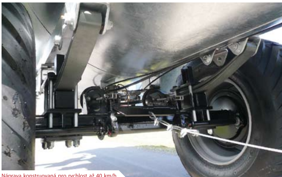
Náprava konstruovaná pro rychlost až 40 km/h

Pro zemědělské provozy je model VE 8.000 fekálním vozem s příznivým poměrem ceny a výkonu. Širokoprofilové pneumatiky zajišťují jízdu po pozemku s minimálním poškozením povrchu. Hlavními rysy fekálního vozu s objemem 8.000l jsou značkový kompresor JUROP, náprava od firmy BPW je konstruovaná pro rychlost 40 km/h, vzduchové brzdy, hydraulické zvonové šoupátko a širokoúhlý kloubový hřídel originál Walterscheid.