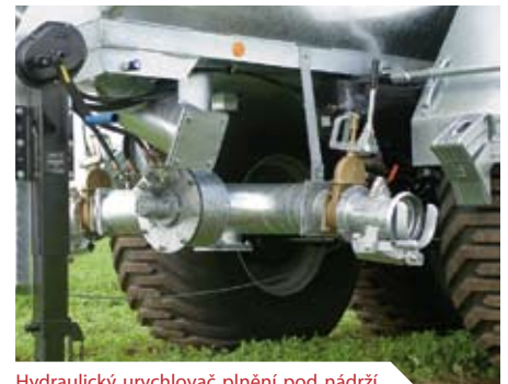
Hydraulický urychlovač plnění pod nádrží