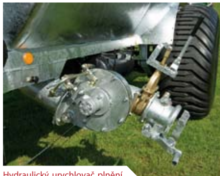
Hydraulický urychlovač plnění